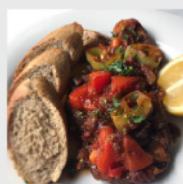
• Бродет од риба (300г) со потпечено лепче 180 ден.