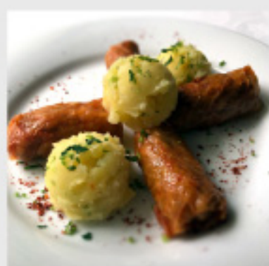
• Посна сарма (250г) со прилог пире (200г) 150 ден.