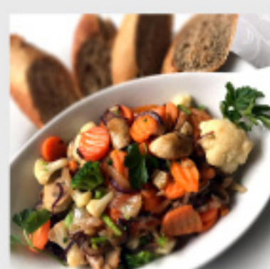
• Мешан зеленчук (300г) со потпечено лепче 130 ден.