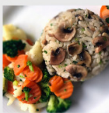
• Ориз со печурки и вариво (300г) 150 ден.