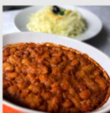
• Грав (300г) со зелка салата (300г) 140 ден.

Ресторан 14ка направи избор на вкусни посни предлози, на кои не можете да останете рамнодушни. Уживајте во омилениот вкус.