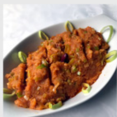
• Макало (300г) со потпечено лепче 130 ден.