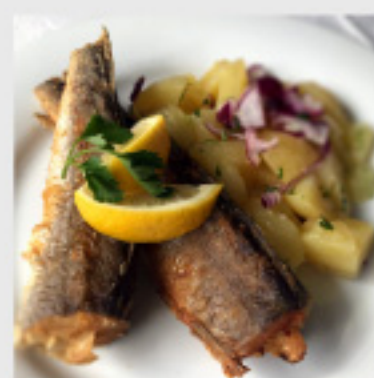
• Ослик (250г) со компир салата (200г) 150 ден.